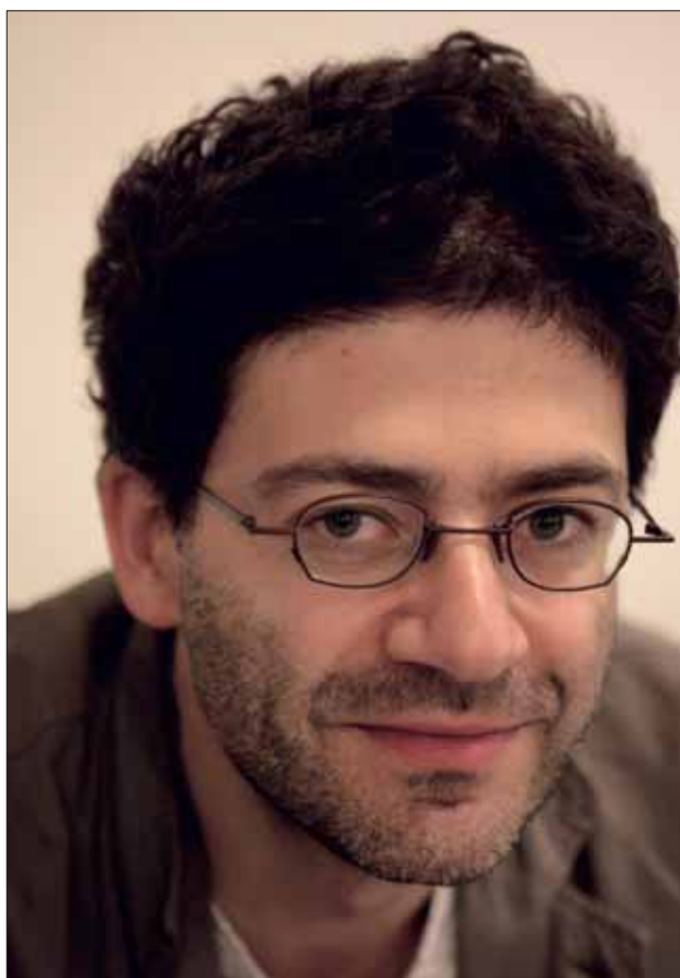
Wajdi Mouawad.

Mit »eindrucksvoller Sprachgewalt« ( Die Welt ) nimmt der 1968 im Libanon geborene frankokanadische Autor Wajdi Mouawad in VERBRENNUNGEN den Leser mit auf eine lange Reise, auf der schonungslos von den Anlässen für Gewalt und Blutvergießen berichtet wird. Mouawad erzählt, wie die Geschwister Jeanne und Simon die Vergangenheit ihrer Mutter Nawal erkunden, die vor dem Krieg im Nahen Osten in den sicheren Westen geflohen war, um sich dort eine neue Existenz aufzubauen. Nawals letzter Wille überträgt den Zwillingen die Aufgabe, zwei Briefe zu übermitteln: einen an ihren tot geglaubten Vater, den anderen an einen unbekanntem Bruder. Widerwillig nehmen die beiden die Reise in die Heimat ihrer Mutter auf sich. Die Suche nach den eigenen Wurzeln führt sie in die kollektive Tragödie des Krieges zurück.