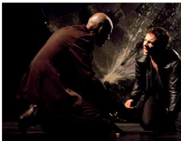
Aufführungsfoto QUAI WEST

»Die Ränder in der Mitte der Gesellschaft, die Abgründe gleich neben dem Vordergrund hat Koltès mit Figuren gefüllt, die lebendige Menschen sind und doch auch immer Träger einer Haltung, einer spezifischen Form von Da-Sein.« die tageszeitung